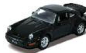
Porsche 964 Turbo