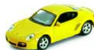
PORSCHE CAYMAN S