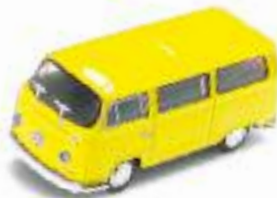
VW T2 Camper