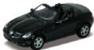
Mercedes Benz SLK 350