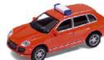
Porsche Cayenne Feuerwehr