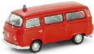
VW T2 Feuerwehr