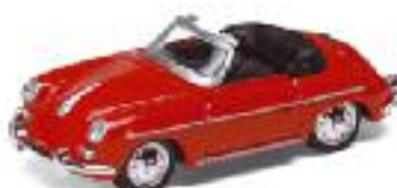
Porsche 356 B