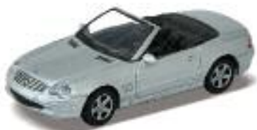
Mercedes Benz SL 500